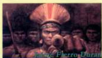
Atelier Origem Brasil Av. Elias Yasbeck, 426 F: 4704-7193/9744-4713