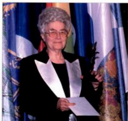
Chiara Lubich recebe o Prêmio Unesco pela Educação à Paz, em Paris, 17/12/96.

C.: Sim, que caminha para o bem, para a unidade. É isso mesmo. Aliás, paradoxalmente, nós aqui e os membros do nosso Movimento nos Estados Unidos, dizemos a mesma coisa. Temos como ideal um mundo melhor, um mundo unido. Dizemos uns aos outros: nessa situação, paradoxalmente, as portas... se abrem para chegar mais rápido à unidade.