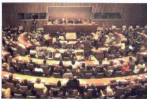
Em maio de 1997, Chiara afirmou a representantes de organismos internacionais e diplomatas na ONU: "Excluir a guerra não basta. Devem ser criadas condições para que cada povo seja impelido a mar a pátria alheia como a própria, numa troca desinteressada de dons". Teve início uma nova fase do diálogo dos Focolares com a cultura de hoje.

C.: Quando vi, incredivelmente, aquelas torres desmoronando, diante de tamanha tragédia, do choque de uma super potência que, repentinamente, se torna vulnerável e se depara com a ruína de muitas certezas, diante do medo de uma guerra com consequências imprevisíveis, tive a impressão de reviver o que passei em Trento, sob os bombardeios da Segunda Guerra Mundial. Tudo desmoronava e era forte o questionamento: será que existe alguma coisa que nenhuma bomba pode destruir? A resposta foi esta: sim, existe. É Deus. Deus que descobrimos como Amor. Uma descoberta fulgurante que nos deu a certeza de que Ele não nos abandona, de que Ele nunca está ausente na história, pelo contrário: sabe canalizar tudo o que acontece para o bem. Experimentei isso de modo palpável, surpreendente. Perguntei a mim mesma: será que justamente agora, no início do século XXI, Deus está querendo repetir esta grande lição, levando-nos a recolocá-lo em primeiro lugar na nossa vida, constrangendo-nos a colocar todas as outras coisas em segundo plano? Isso me fala de esperança e de futuro. Portanto, o que todos vêm como um retrocesso, para mim teve um significado diferente. Percebi que essa visão da realidade está aflorando também na alma dos americanos. Foi o que me disseram as pessoas de lá.