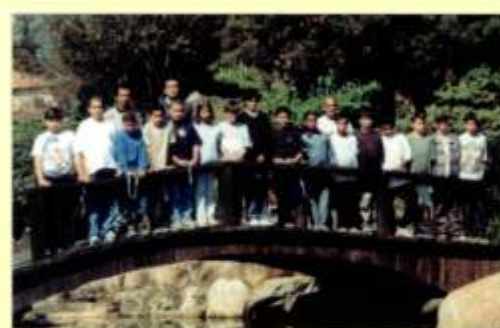
Grupo de escoteiros do período da tarde, na Praça Japonesa, em Cotia.

Uma moradora antiga da região, que sempre frequentou a feira do Parque São George, foi vítima de um seqüestro-relâmpago ao sair da feira com suas compras. Os bandidos só a liberaram depois de roubarem pertences e dinheiro. Alguns policiais deveriam assegurar a tranquilidade dos frequentadores da tradicional feira, que acontece todas às quartas.