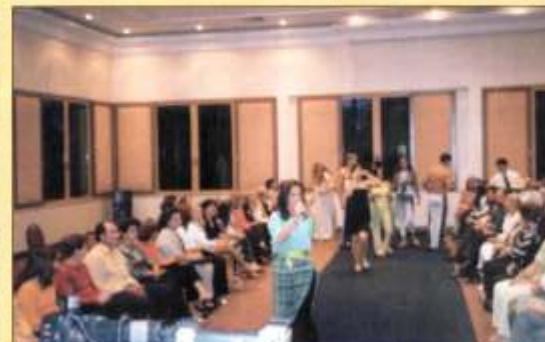
Salão novo do Centro de Convenções do Hotel Villa Rossa lotado para o desfile.