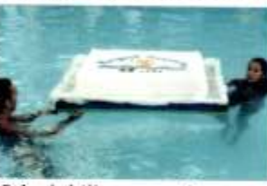
Bolo simbólico, carregado pelas garotas do nado sincronizado.