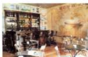
Graf Zeppelin Bar