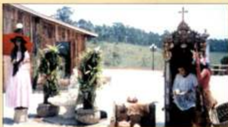
Lado externo do Espaço com algumas atividades, como estátua viva.