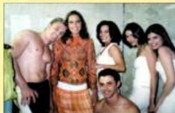
Modelos nos bastidores.