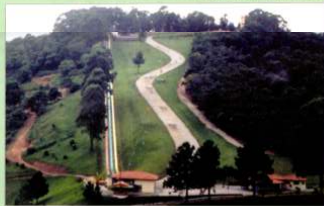
Vale a pena conhecer o parque de montanha em São Roque, com restaurantes, artesanato e outros.