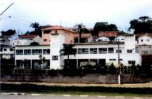
Criança Feliz Rua Urbano Mendes da Silva, 45 Caucaia do Alto - Cotia - SP Fones: 4611-1129 e 4611-1805.

Sendo uma associação filantrópica, a entidade vive de contribuições de sócios e empresas. "Apesar de toda a luta, ainda não conquistamos a independência econômica. A cada ano nos esforçamos para manter a qualidade e o número de crianças atendidas. Daí a necessidade de buscarmos parceria com empresas da região", afirma a diretoria.