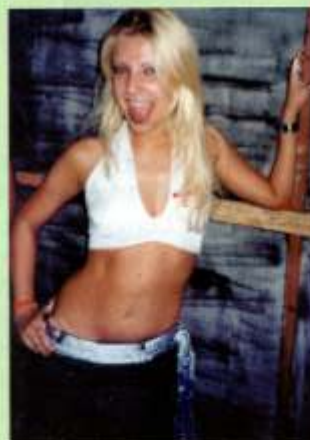
Tenho orgulho de ter uma amiga vencedora e parabéns por mais um ano de vida.