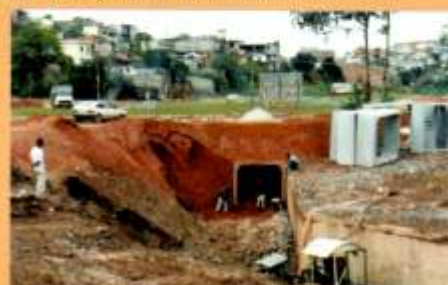
Canalização do córrego para maior aproveitamento da área.

A previsão para o término das obras é o meio do ano. Para tanto, a Prefeitura espera implementar um sistema viário que circulará ao redor da Aldeia, e não por meio dela, como vem acontecendo.