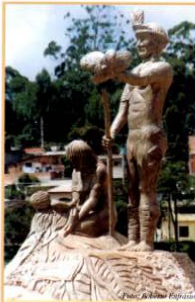
Estátua construída na entrada da Aldeia, homenageando os índios