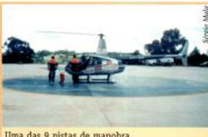
Uma das 9 pistas de manobra.

Instalado na Aldeia de Carapicuíba, em uma área de 50.000 m 2 , o heliporto tem capacidade para até 150 helicópteros estacionados em seus três ângares. "A área é totalmente aberta, garantindo segurança para o pouso e para decolagem.