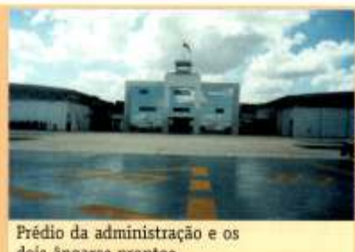
Prédio da administração e os dois ângares prontos

Em obras desde dezembro de 2000, a conclusão da construção está prevista para meados de abril.