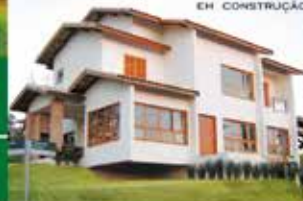
FOTO DE UMA DAS 40 CASAS EM CONSTRUÇÃO