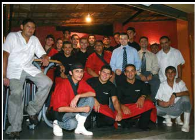
Equipe Kazan Granja Viana: Estamos esperando para bem servi-los!