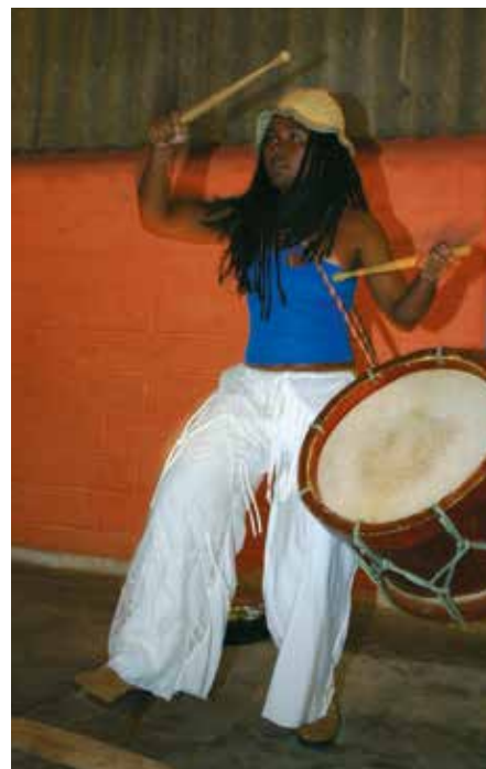
Única integrante feminina da banda Acorda Povo

As bandas nasceram na Cohab de Carapicuíba e têm a ajuda da OCA. Cada uma com cerca de 13 componentes, com idades entre 13 e 25