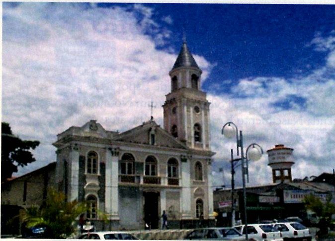
Fachada Igreja Monte Serrat

No dia 2 de abril de 1856, o vice-presidente da Província de São Paulo, Antonio Roberto de Almeida, elevou a então Freguesia de Acutia para a condição de Vila, iniciando, com isso, a emancipação política – administrativa. O município teve um crescimento acelerado a partir de 1750. Segundo o censo da época, Cotia tinha 3.770 habitantes, sendo 17% escravos, trabalhando em fazendas e sesmarias, e 83% cidadãos livres. Histórica e geograficamente, pontos como Cotia, Embú, Itapevi, Barueri e Itapeçerica da Serra passaram a ser fortes e postos naturalmente avançados para defesa e o abastecimento da Vila e do Planalto de Piratininga.