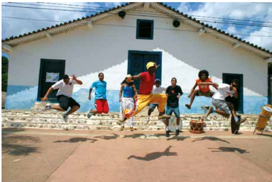
A banda Acorda Povo contagia com seu ritmo e alegria

berimbaus e outros instrumentos e as diversas manifestações populares como samba de roda, fundamentos de capoeira e percussão. Já tocou nos internatos da Febem e nos Ceus, além de viajar pelo interior de São Paulo levando seus conhecimentos “Eu estou envolvido neste lado social porque quero morar em São Paulo e estar em contato com as minhas raízes. Além disso, a percussão e a capoeira são uma válvula de escape para esses jovens”.