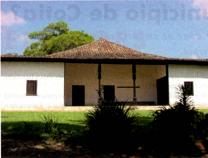
Sítio do Padre Inácio.

em 1713, e localiza-se no centro da cidade. Reserva Florestal do Morro Grande – Patrimônio da Humanidade, Reserva da Biosfera do Cinturão Verde da Cidade de São Paulo. Sob responsabilidade da Sabesp – Cia de Saneamento do Estado de São Paulo, em parceria com a USP/UNICAMP/CETESB/Polícia Florestal, entre outros, são 4.200 alqueires de mata nativa e 70 km de perímetro em seu entorno, que abrigam importante