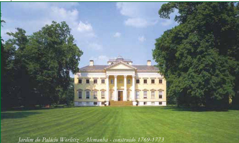
Jardim do Palácio Worlitz - Alemanha - construído 1769-1773

Primeiro William Kent (1685- 1748) e depois “capability” Brown (1716- 1783), dois paisagistas formidáveis, podem ser considerados os principais responsáveis por terem preenchido com gramados toda a Inglaterra. Kent desenhava seus jardins de maneira livre, tentando sempre um resultado bucólico. Brown, usando a topografia da região, imprimia em seus trabalhos, onde sempre aparecem lagos ou rios naturais, uma sensação de calma muito grande.