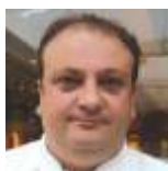
Erick Jacquin p.08