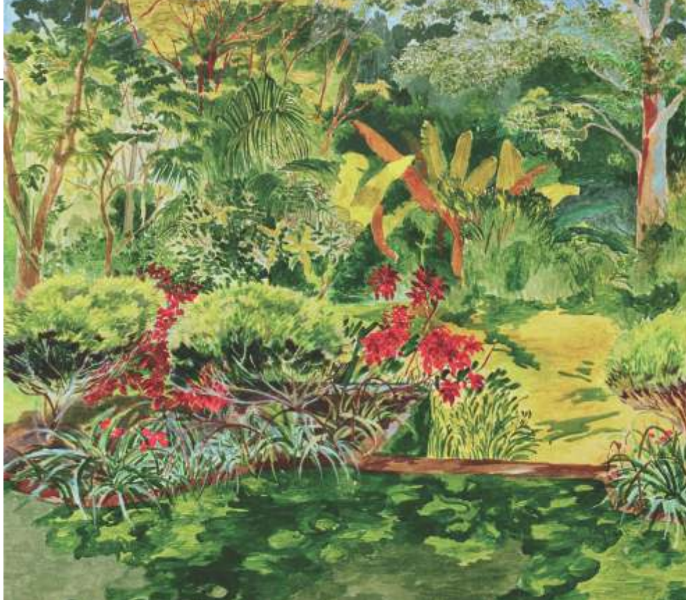
Uma de suas telas inspirada em seu jardim