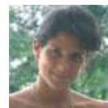
Por onde anda p.16