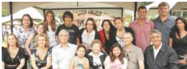
Família Maia reunida na inauguração do Parque Teresa Maia

Mais de duas mil árvores já foram plantadas no local, todas frutos de reflorestamento e replantio que vieram de vários lugares: das obras do Rodoanel, do terreno do futuro shopping da Granja Viana, de obras de condomínios e doações de empresas privadas e organizações não governamentais. O projeto contou com o apoio da Prefeitura e do Rotary Clube, mas principalmente de toda a comunidade da Granja Viana.