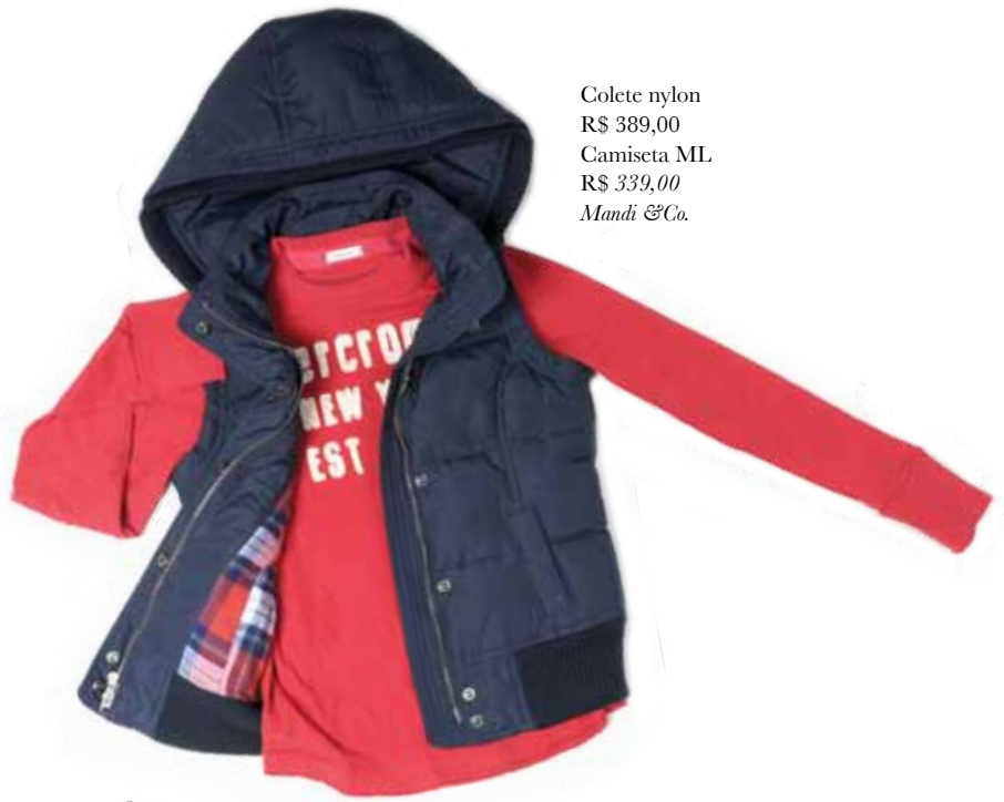
Colete nylon R$ 389,00 Camiseta ML R$ 339,00 Mandi & Co.