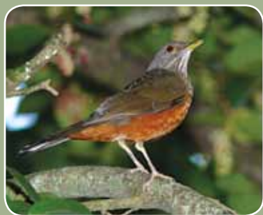
Bichos pág. 20