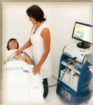
Estética Corporal • Heccus: celulite, gordura localizada e flacidez muscular. Resultados que você pode ver e medir.