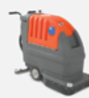
Lavadoras de Piso