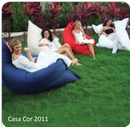
Casa Cor 2011

Projetar é planejar para um resultado eficiente e bonito. Tels.: 4702-9907 e 9299-3121 www.claudiakuhnen.com.br