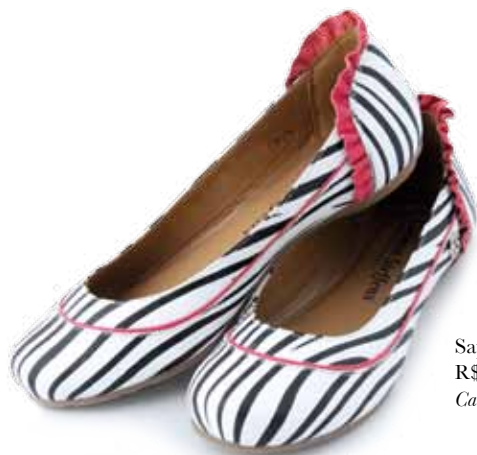
Sapatilha R$ 169,90 Carmen Steffens