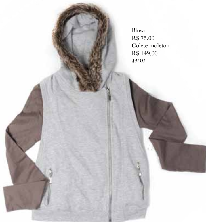
Blusa R$ 75,00 Colete moleton R$ 149,00 MOB

Shopping Granja Vianna: • Mandi & Co. - Tel.: 4613-6880 • Uncle K - Tel.: 4613-6626 • Mentha Pimentha - Tel.: 4613-6767 • Carmen Steffens - Tel.: 4702-4571 • MOB - Tel.: 4702-7262 • Puket - Tel.: 4613-6603 • M - Tel.: 3038-2584 • Mr.Cat - Tel.: 4613-6600 • Chilli Beans - Tel.: 4612-0132 • Imaginarium - Tel.: 4613-6466