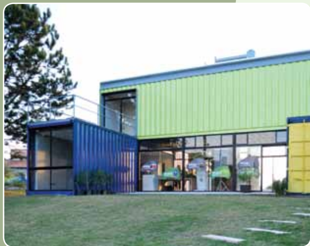
Do lixo ao luxo pág. 36