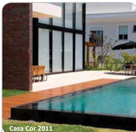
Casa Cor 2011

Economize tempo e dinheiro na hora de construir, reformar e limpar. Alugue equipamentos como andaimes, betoneiras, rompedores, etc. Tel: 4612-4000. www.casadoconstrutor.com.br