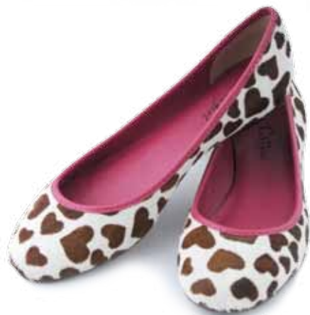
Sapatilha R$ 134,80 Mr.Cat