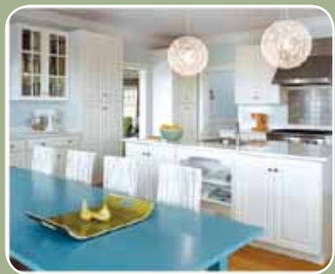
Garimpando Casa e Construção pág. 40