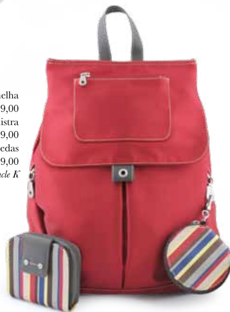
Mochila vermelha R$ 259,00 Carteira listra R$ 109,00 Chaveiro para moedas R$ 69,00 Uncle K