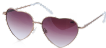
Óculos coração R$ 88,00 Chilli Beans