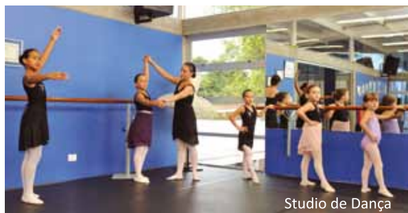
Studio de Dança

A partir de agosto de 2011, novos cursos: Teatro, Musicalização e Dança de Salão.