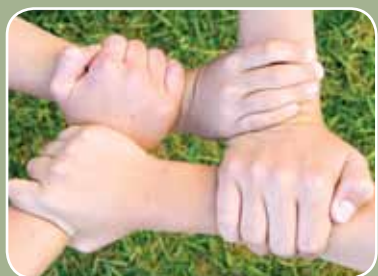
Solidariedade pág. 43