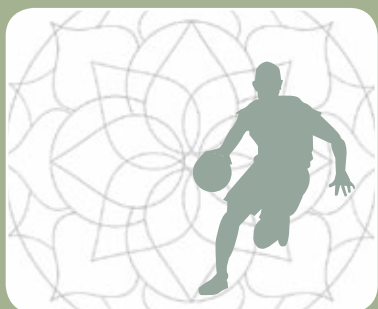
Guia de Cursos pág. 45