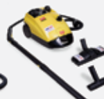
Lavadoras à Vapor