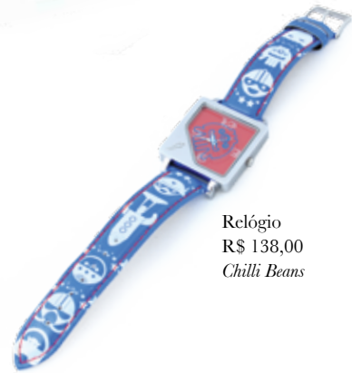
Relógio R$ 138,00 Chilli Beans