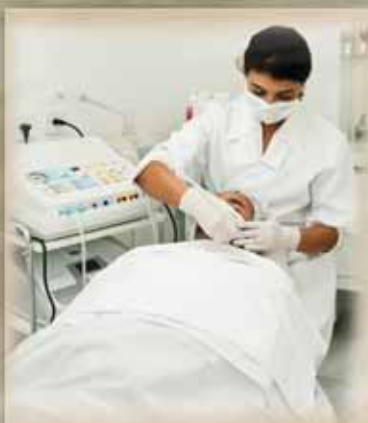
Estética Facial • Rejuvenescimento facial com radiofrequência • Limpeza de pele profunda • Maquiagem definitiva • Peeling de inverno