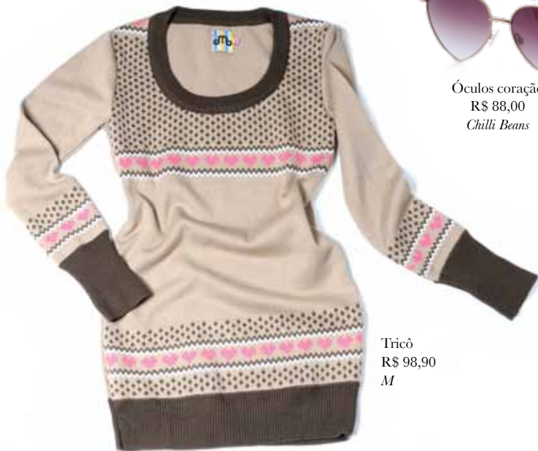
Tricô R$ 98,90 M