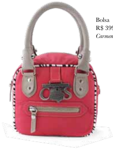
Bolsa R$ 399,90 Carmen Steffens