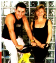
Winner & Fitnes