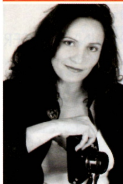
Foto Jornalismo Books • Produção Festas e Eventos Maquiagem - Dia da Noiva Sites e Catálogos

Rua José Félix de Oliveira, 834 - Lj04 - Félix Boulevard Granja Viana - Cotia