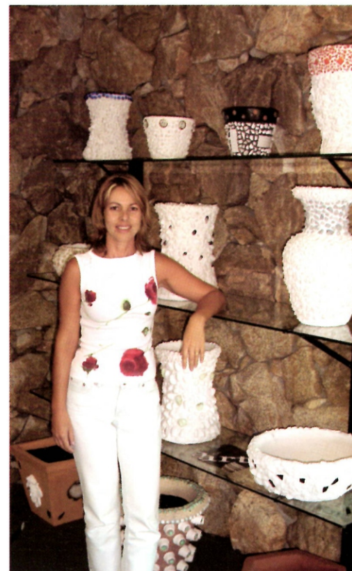
Goldsan - Telefone: 4613.8800 - Email: goldsan@goldsan.com.br